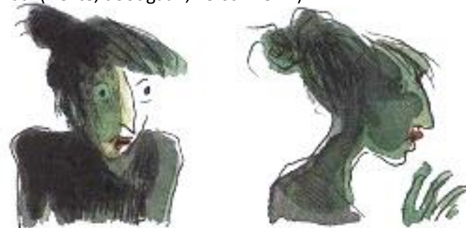
© Judith Vanistendael, 2014 Oog & Blik, De Bezige Bij

Als je niet kan praten, kan je nog altijd dingen uitbeelden of tekenen. Speel in de klas een spelletje Pictionary, maar gebruik woorden die te maken hebben met het stripverhaal (ziekte, doodgaan, verschillen...).